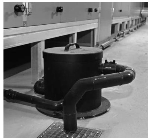
Siphon central pour l'eau de condensation.

Remarque: les isolations intérieures des systèmes de distribution d'air sont à proscrire (voir SICC VA104-01).