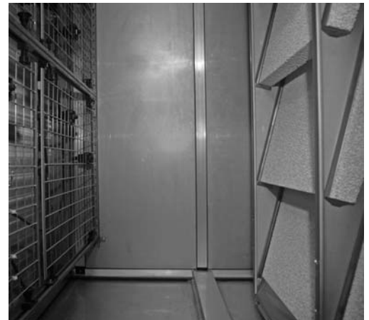
Vue d'un déshumidificateur hybride: l'état hygiénique doit être régulièrement vérifié.

Remarque: les sources d'UV doivent être désactivées lors des travaux de maintenance.