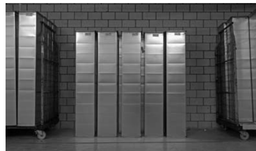
Gaines d'air avant leur installation, entreposées de manière propre et ordonnée.

Des dépôts sont possibles dans les silencieux à cause des poussières. Des germes peuvent s'y développer en raison de l'humidité et de l'eau de condensation.