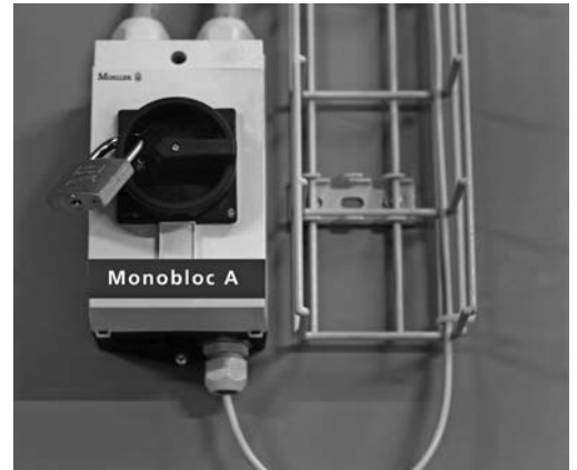
Installation sécurisée par un cadenas personnel.

La mise en sécurité de l'installation lors de l'exécution des travaux de maintenance évite que des membres, des cheveux ou des habits soient happés par l'installation en cas de démarrage imprévu.