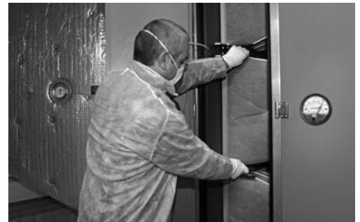
Les filtres doivent être régulièrement remplacés.